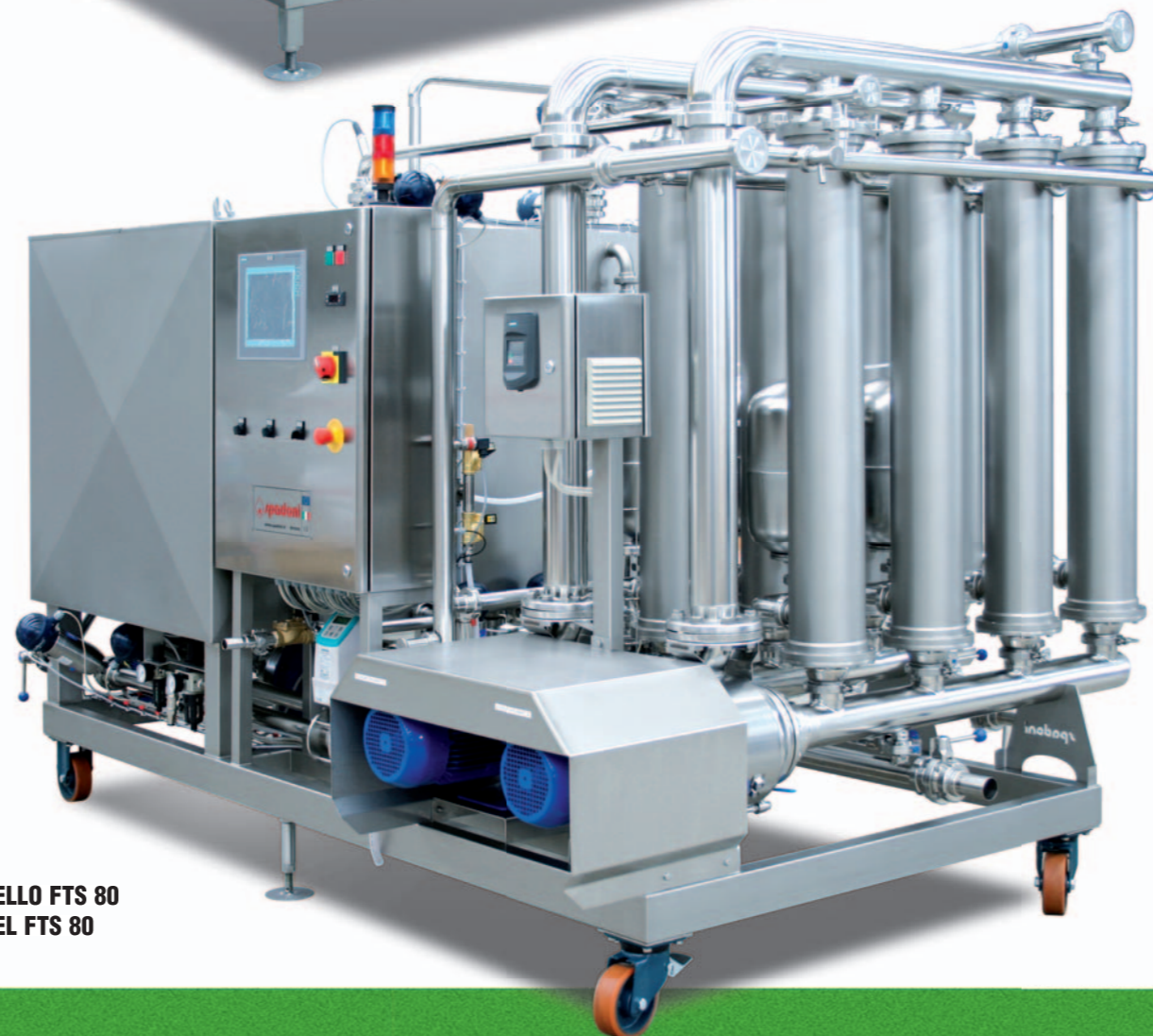
MODELLO FTS 80 MODEL FTS 80