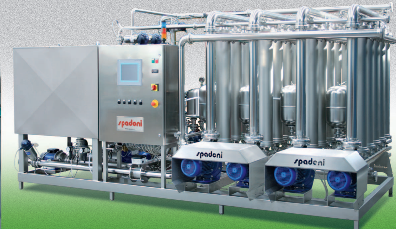
MODELLO FTS 200 MODEL FTS 200